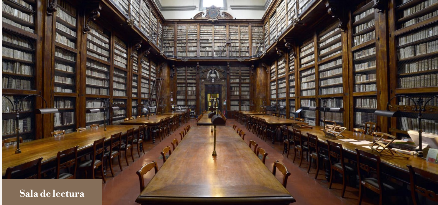
Sala de lectura

El lugar ocupado actualmente por la biblioteca era el jardín del palacio homónimo ubicado en la calle San Gallo, paralela a la actual calle Cavour. La biblioteca nació, por lo tanto, como algo nuevo y no por adaptaciones y cambios de función de edificios ya existentes. La fachada tiene una inscripción con el lema y la finalidad de la biblioteca “ Maxime Pauperum Utilitati ” es decir, sobre todo para el uso de los pobres; por lo tanto, los frequentadores serían aquellos que debido a sus escasos recursos no tenían acceso a la compra de libros; en este marco se decidieron las su-