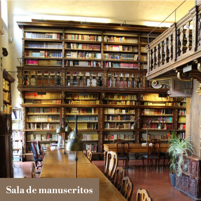
Sala de manuscritos

te la reutilización de muebles pertenecientes a la secretaría particular del gran duque Ferdinando III se renovaron las estanterías de la sala de consulta de manuscritos, dibujos, grabados y obras raras instalando el mobiliario que había pertenecido a la biblioteca medicea palatina en el Palazzo Pitti.. La Biblioteca Marucelliana goza de un jardín accesible, característica que no poseen las bibliotecas presentes en el centro histórico de Florencia, en el que a la sombra de cuatro cipreses, conviven hortensias y rosas. De esta forma, se pueden alternar el estudio y la lectura con un descanso y una conversación entre el verdor.