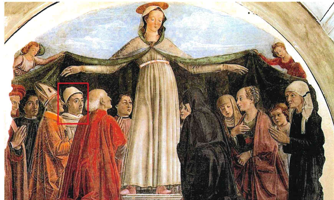
Domenico Ghirlandaio, Madonna della Misericordia , 1472 ca., Firenze, Chiesa di Ognissanti, Cappella Vespucci.